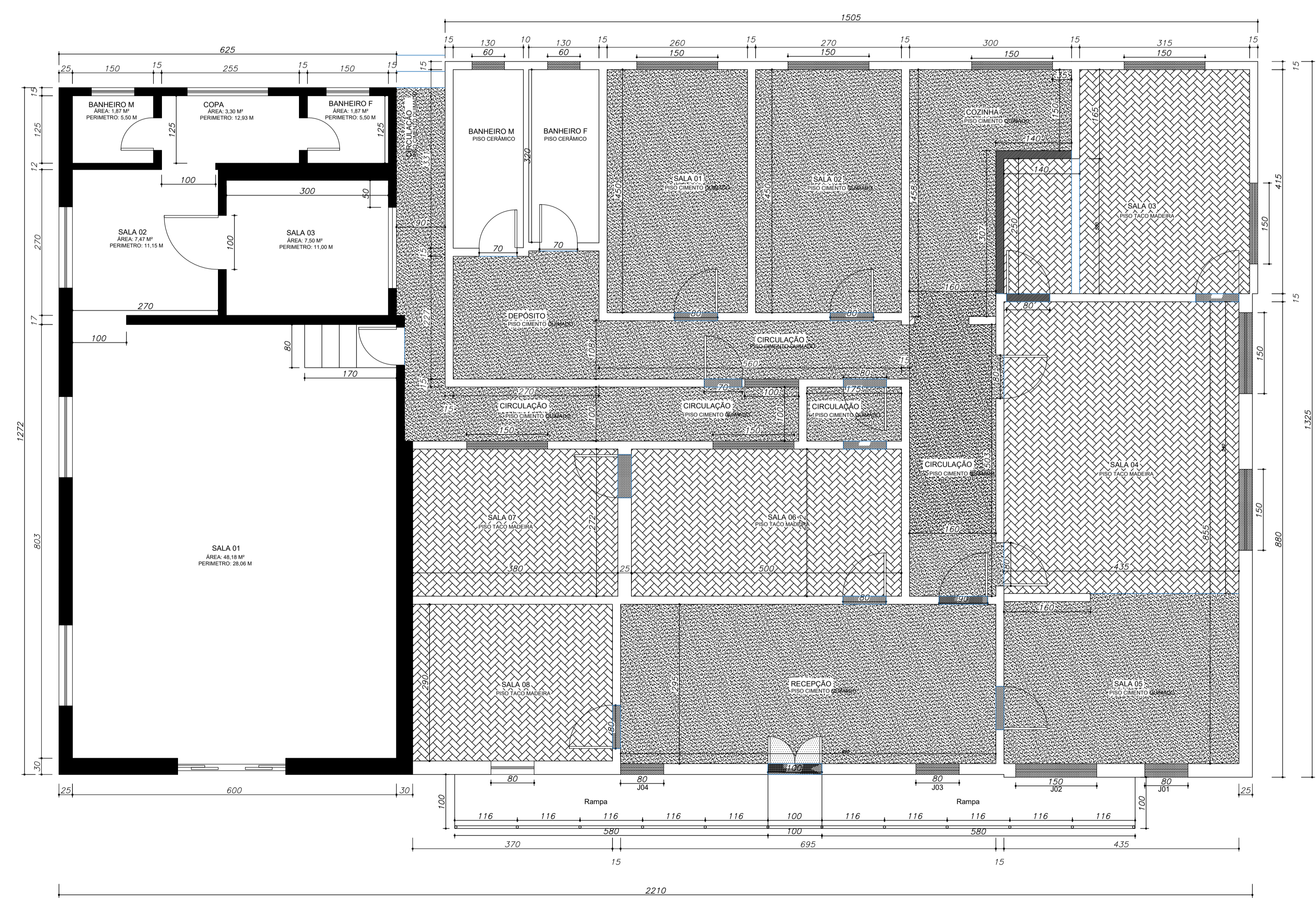
PLANTA BAIXA ESC.: 1/50